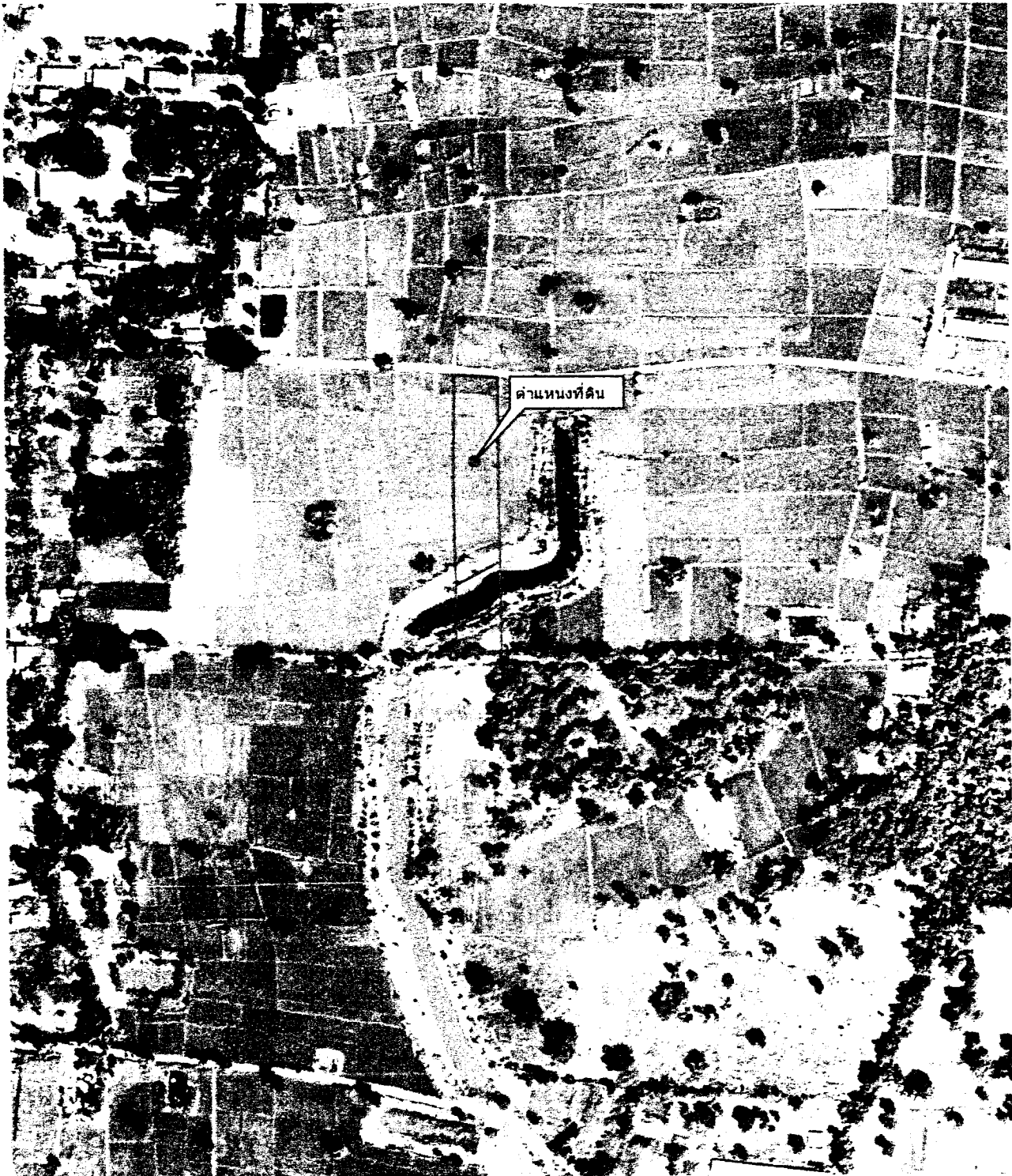
รูปแผนที่ภาพถ่ายทางอากาศ ปี พ.ศ. ๒๕๕๓