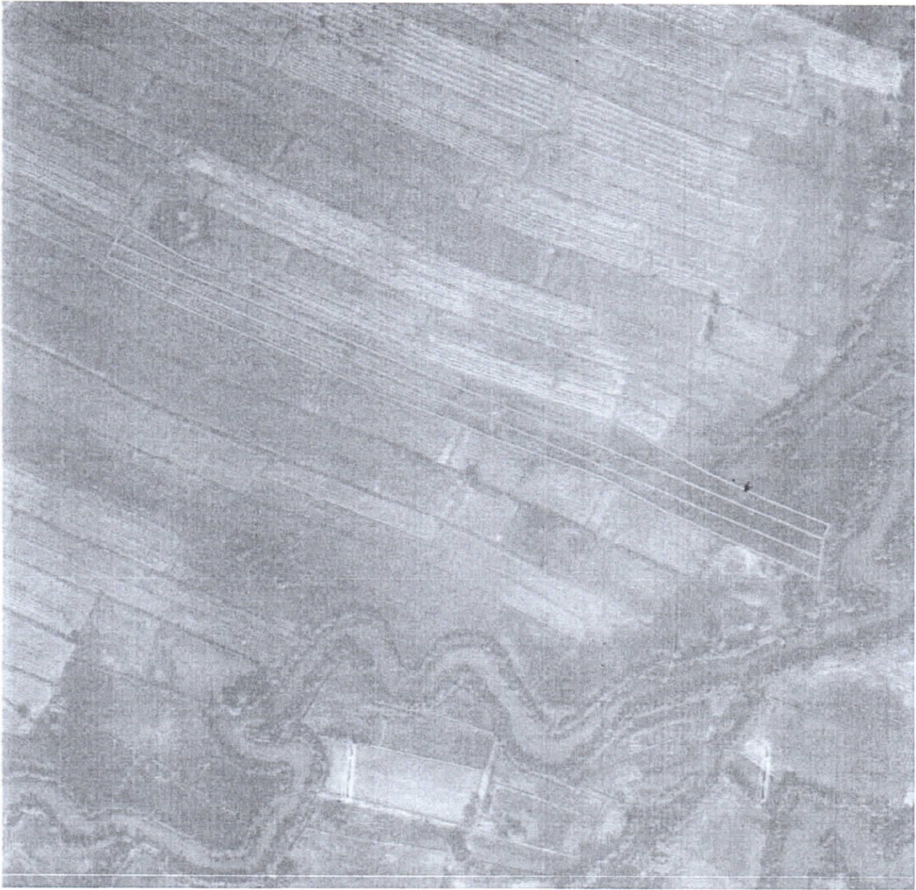
รูปแผนที่ภาพถ่ายทางอากาศปี พ.ศ.๒๕๕๗