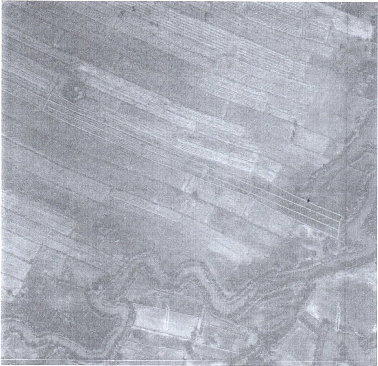
รูปแผนที่ภาพถ่ายทางอากาศปี พ.ศ.๒๕๕๓