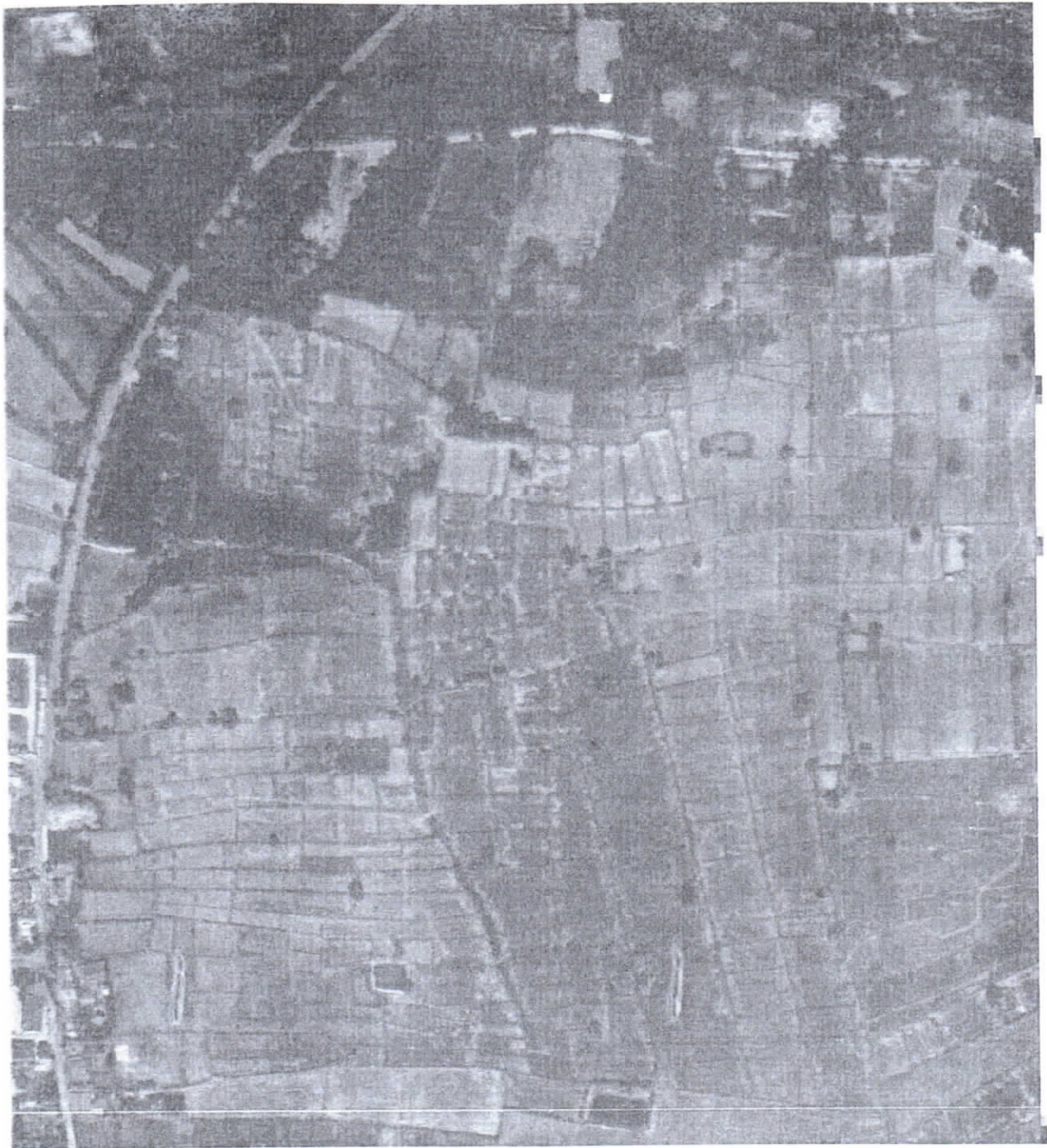
รูปแผนที่ภาพถ่ายทางอากาศปี พ.ศ.๒๕๕๓