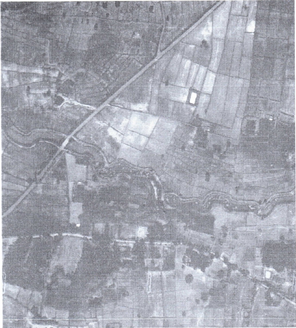
รูปแผนที่ภาพถ่ายทางอากาศปี พ.ศ.๒๕๕๓