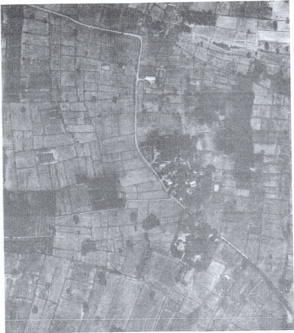
รูปแผนที่ภาพถ่ายทางอากาศปี พ.ศ.๒๕๕๗