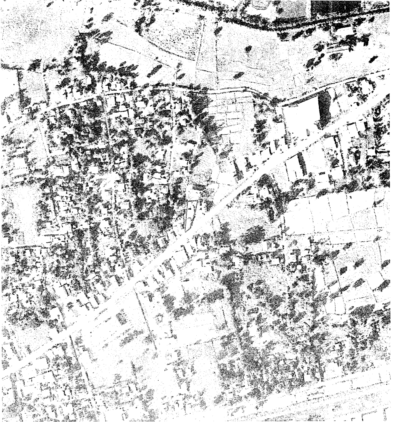
รูปแผนที่ภาพถ่ายทางอากาศปี พ.ศ.๒๕๕๓