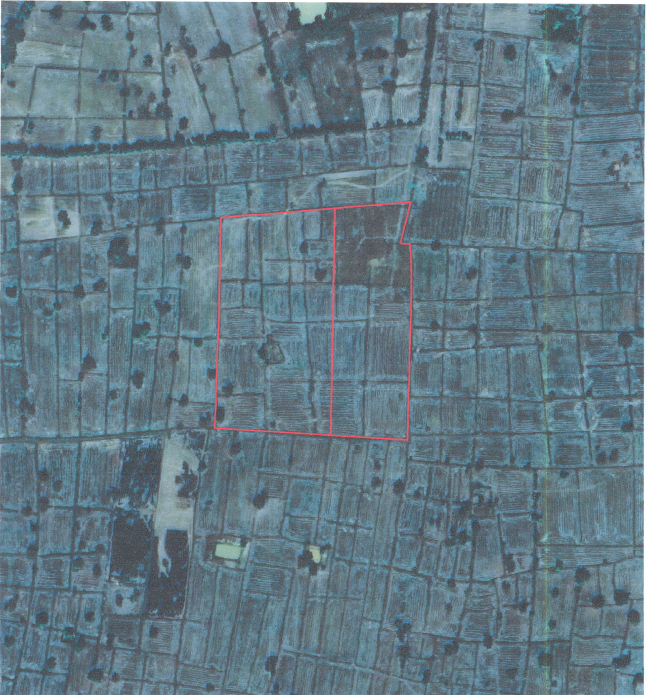
รูปแผนที่ภาพถ่ายทางอากาศปี พ.ศ.๒๕๕๗