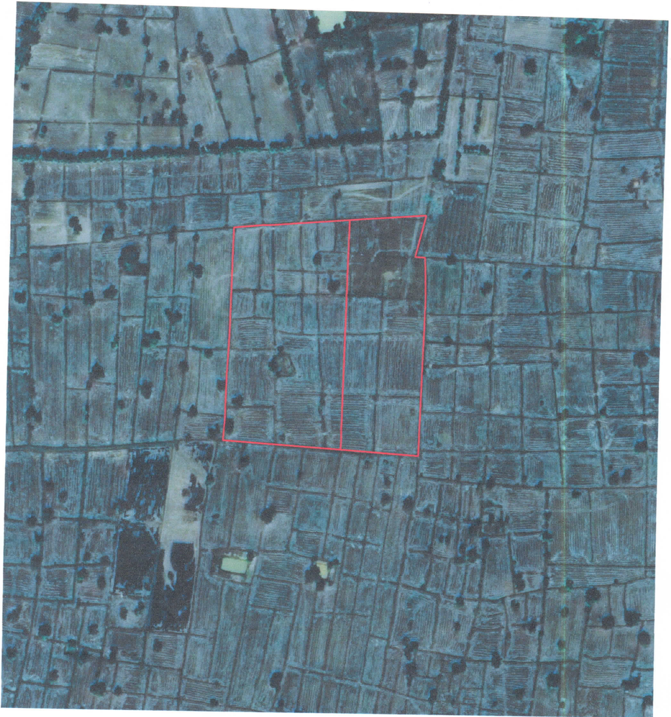
รูปแผนที่ภาพถ่ายทางอากาศปี พ.ศ.๒๕๕๓