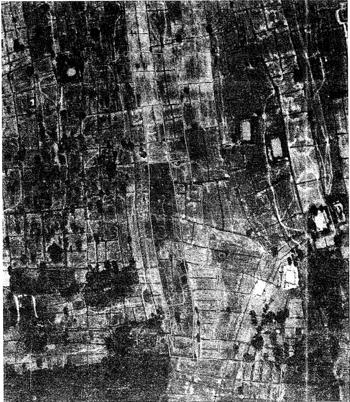
รูปแผนที่ภาพถ่ายทางอากาศปี พ.ศ.๒๕๕๖