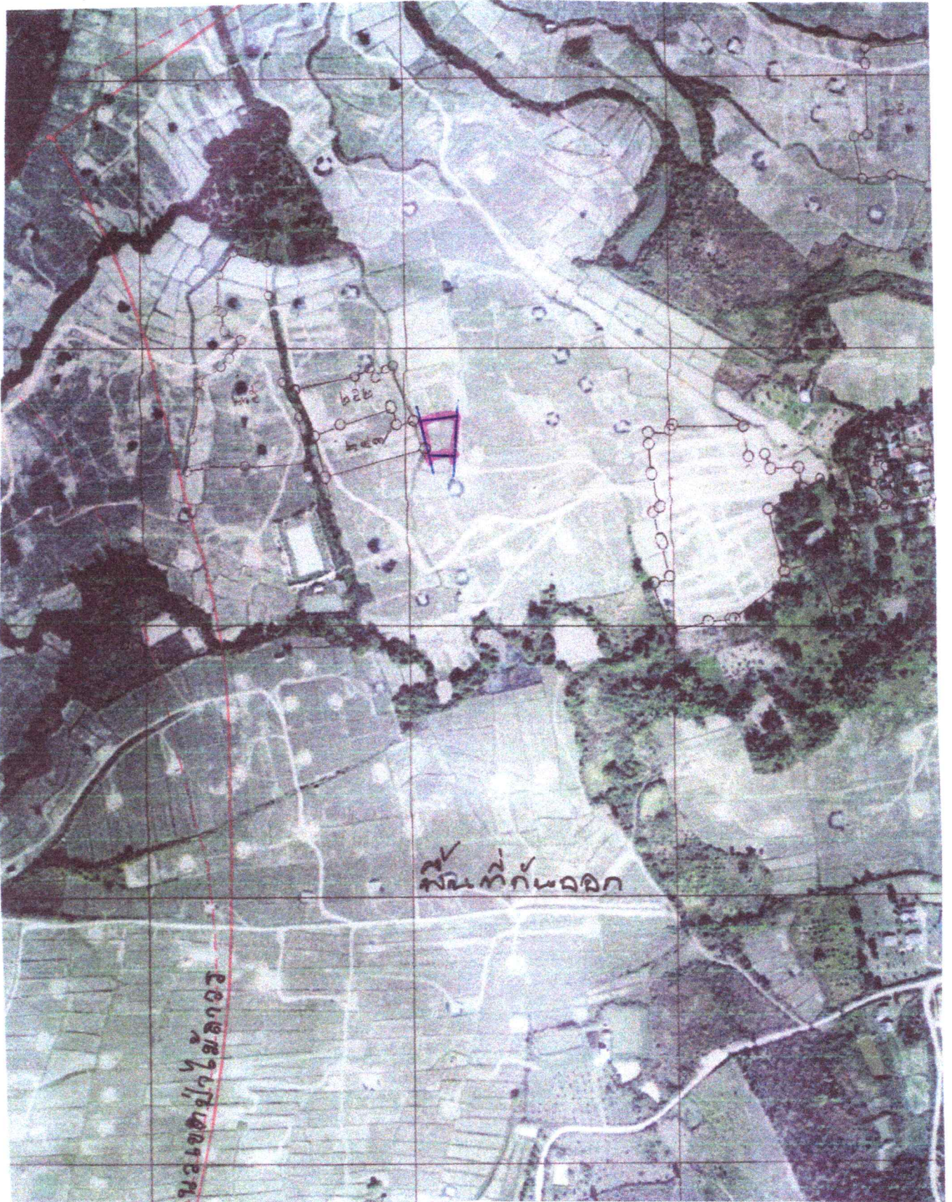
แผนที่รูปถ่ายทางอากาศนี้ได้จัดทำขึ้นในปี พ.ศ.๒๕๔๕