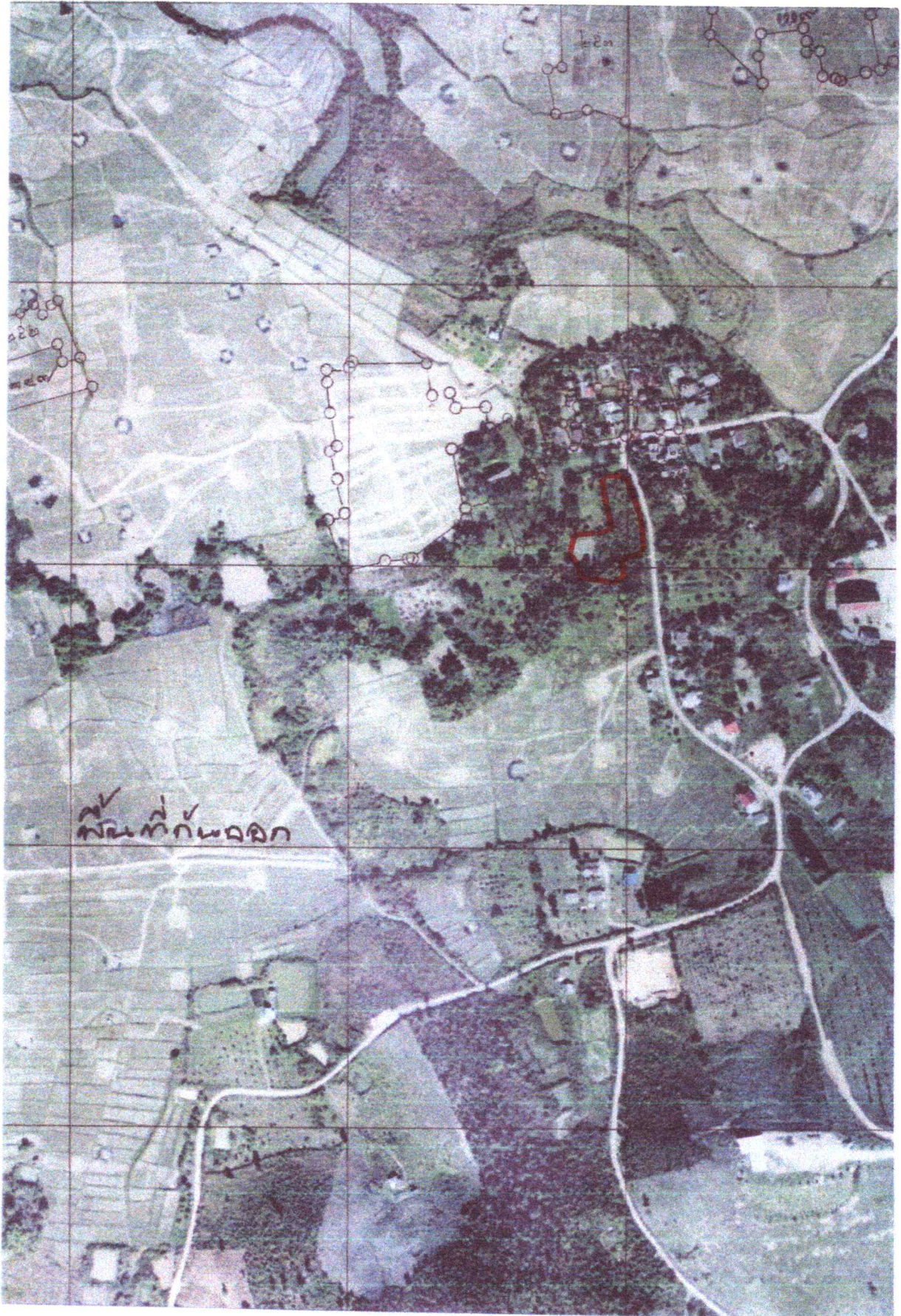
แผนที่รูปถ่ายทางอากาศนี้ได้จัดทำขึ้นในปี พ.ศ.๒๕๔๕