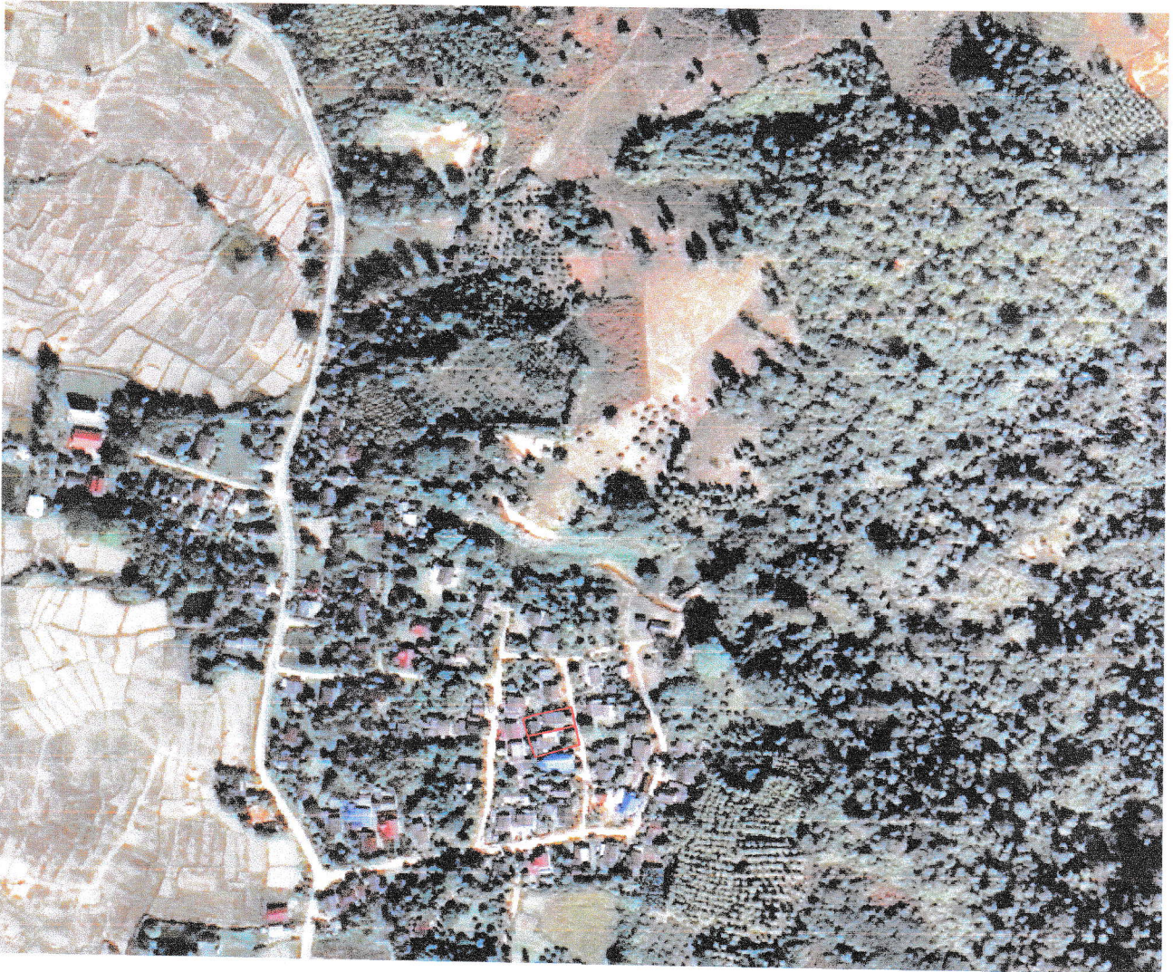
ภาพถ่ายทางอากาศนี้จัดทำขึ้นในปี พ.ศ.๒๕๕๖ — เส้นสีแดงแสดงแนวเขตที่ดินที่ทำการรังวัด