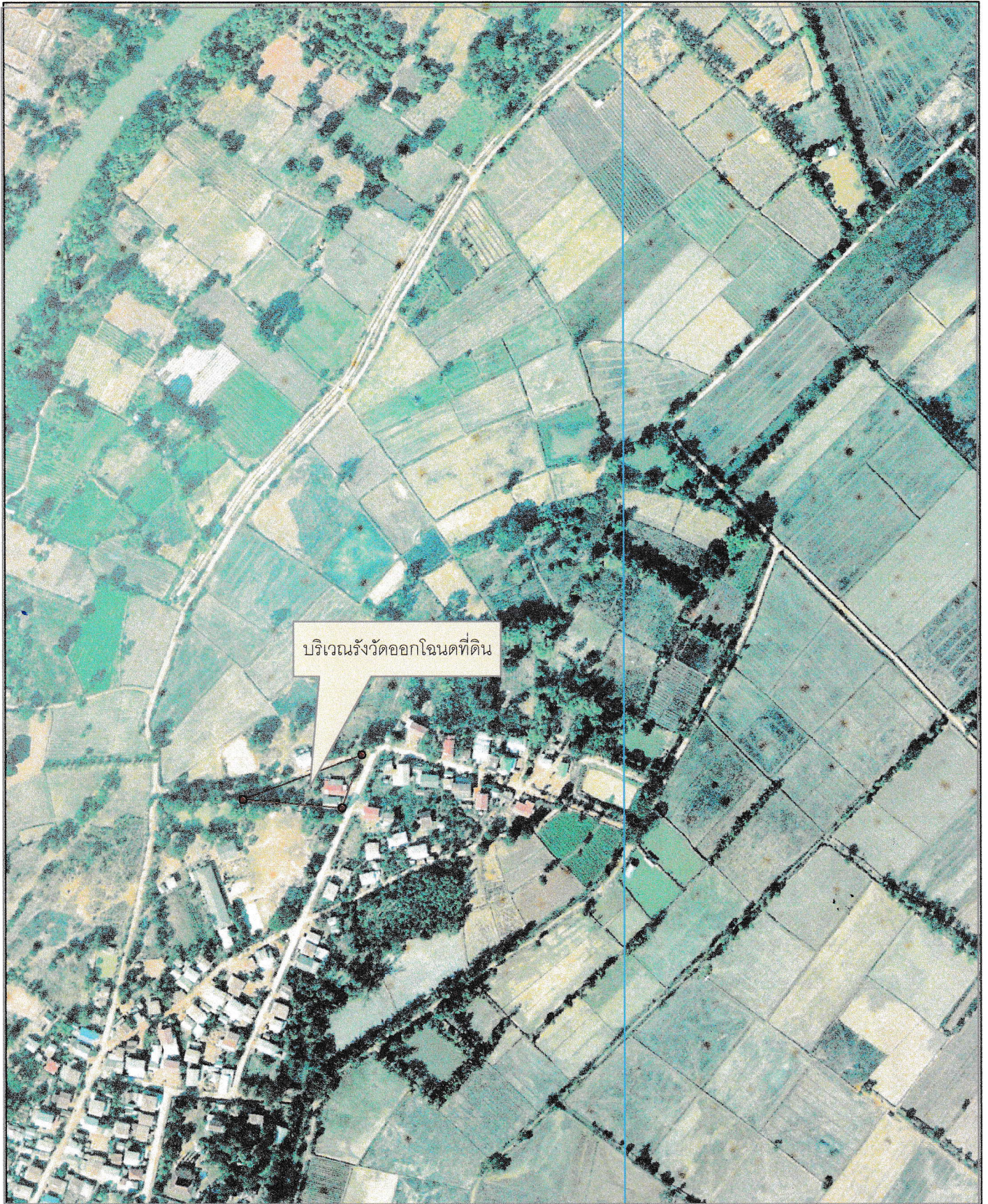
บริเวณตำแหน่งที่ดินที่ทำการร้วัดและประกาศออกโฉนดที่ดิน