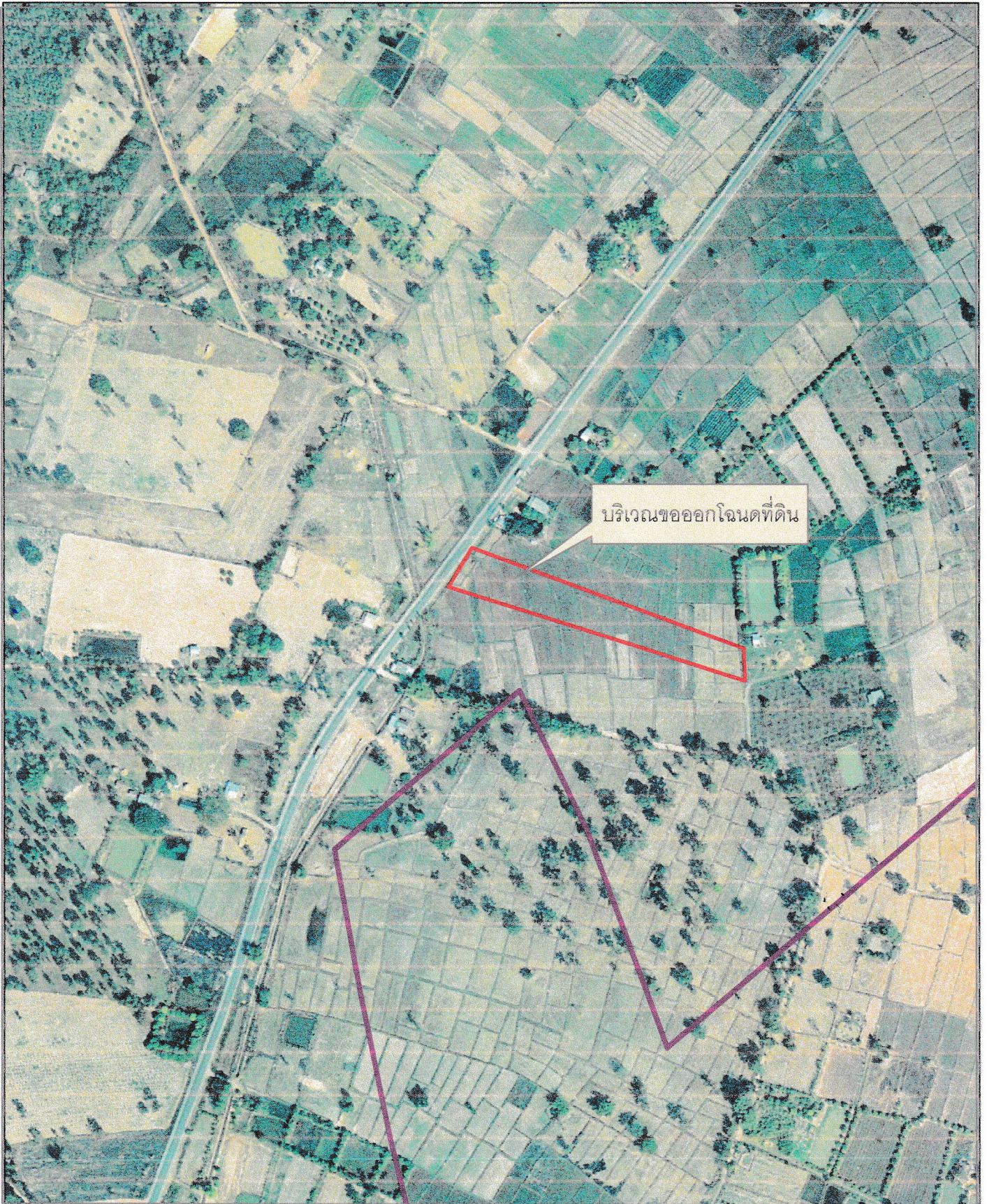
บริเวณตำแหน่งที่ดินที่ทำการรังวัดและประกาศออกโฉนดที่ดิน