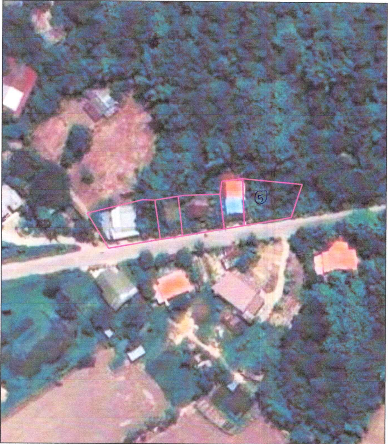
ภาพถ่ายทางอากาศนี้จัดทำขึ้นในปี พ.ศ.2556 — สีชมพูแสดงแนวเขตที่ดินที่ขออนุญาตที่ดิน