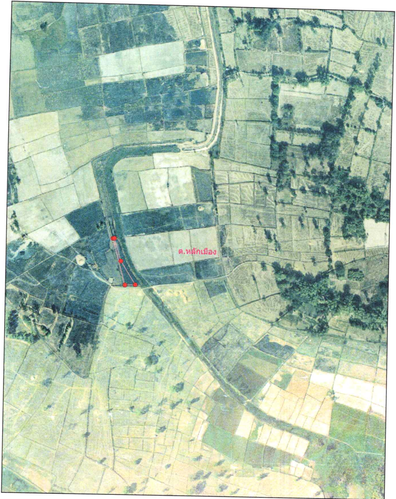
ภาพถ่ายทางอากาศนี้จัดทำขึ้นในปี พ.ศ.2545 — เส้นสีชมพูแสดงแนวเขตที่ดินที่ขออนุญาตที่ดิน