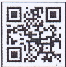
ระบบค้นหารูปแปลงที่ดิน

ฉะนั้น จึงขอให้ท่านไปตรวจสอบแนวเขตที่ดินของท่านว่า ตามที่ผู้ขอพนักงานเจ้าหน้าที่ทำการ รังวัดปักหลักเขตที่ดิน ไว้แล้วนั้น จะเป็นการถูกต้องหรือเหลื่อมล้ำแนวเขตที่ดินของท่านหรือไม่ เสร็จแล้วขอให้ท่านไปพบพนักงานเจ้าหน้าที่ เพื่อลงชื่อรับรองแนวเขตหรือคัดค้านภายในกำหนด ๓๐ วัน นับแต่วันที่ได้อ ส่งหนังสือนี้ หากท่านไม่ดำเนินการอย่างหนึ่งอย่างใด ภายในกำหนดดังกล่าว พนักงานเจ้าหน้าที่จะดำเนินการแก้ไขแผนที่ หรือเนื้อที่ให้แก่ผู้ขอ โดยไม่ต้องมีการรับรองแนวเขต ตามมาตรา ๖๙ ทวิ แห่งประมวลกฎหมายที่ดิน ซึ่งแก้ไขเพิ่มเติมโดย พระราชบัญญัติแก้ไขเพิ่มเติมประมวลกฎหมายที่ดิน (ฉบับที่ ๔) พ.ศ. ๒๕๒๘