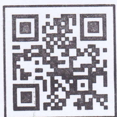
ระบบค้นหารูปแปลงที่ดิน

พระราชบัญญัติแก้ไขเพิ่มเติมประมวลกฎหมายที่ดิน (ฉบับที่ ๔) พ.ศ. ๒๕๒๘