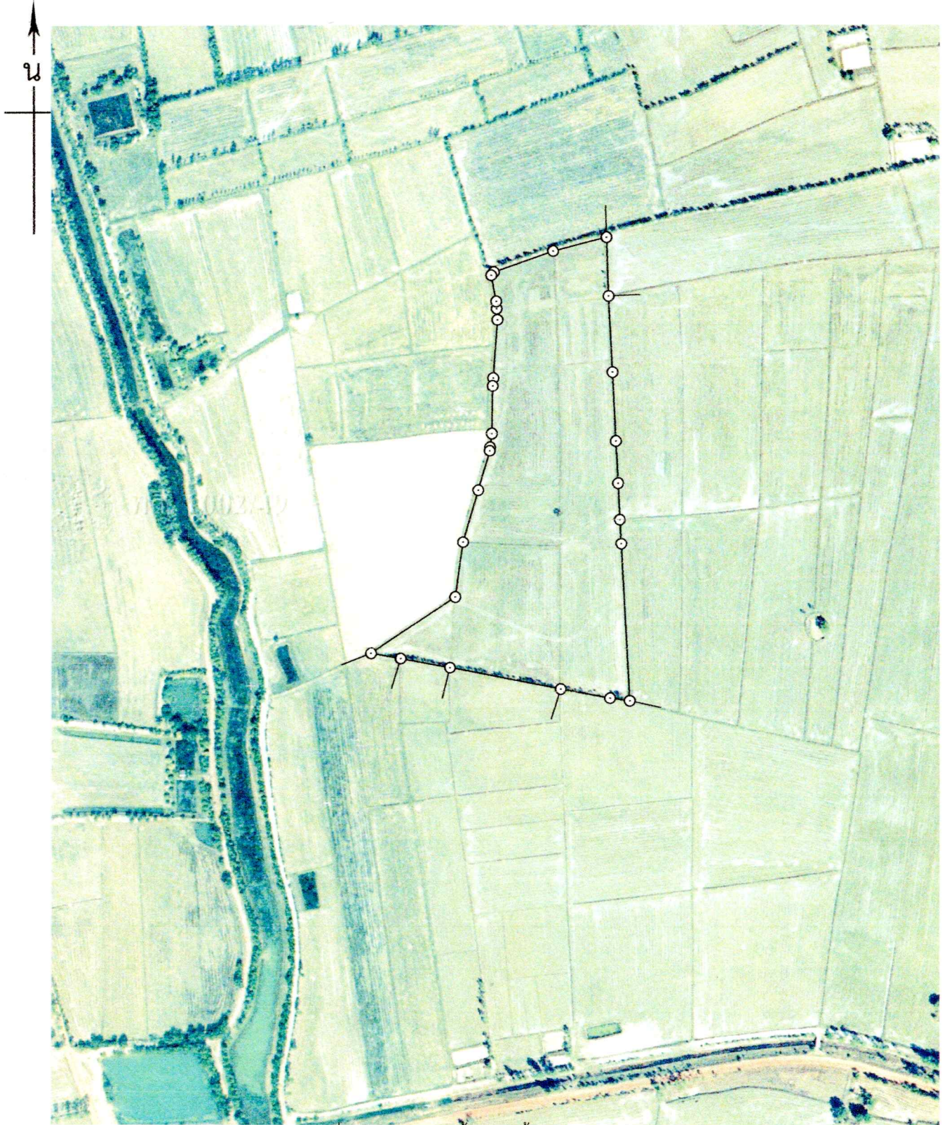
แผนที่รูปถ่ายทางอากาศนี้ได้จัดทำขึ้นในปี พ.ศ. 2554