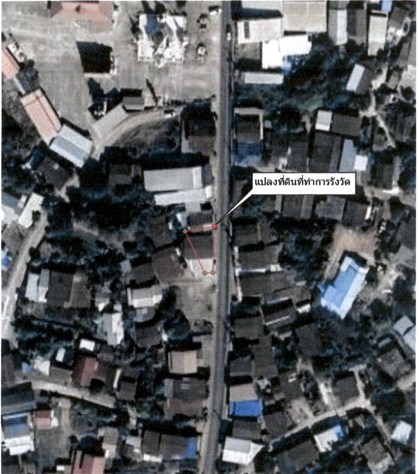
ภาพถ่ายทางอากาศ