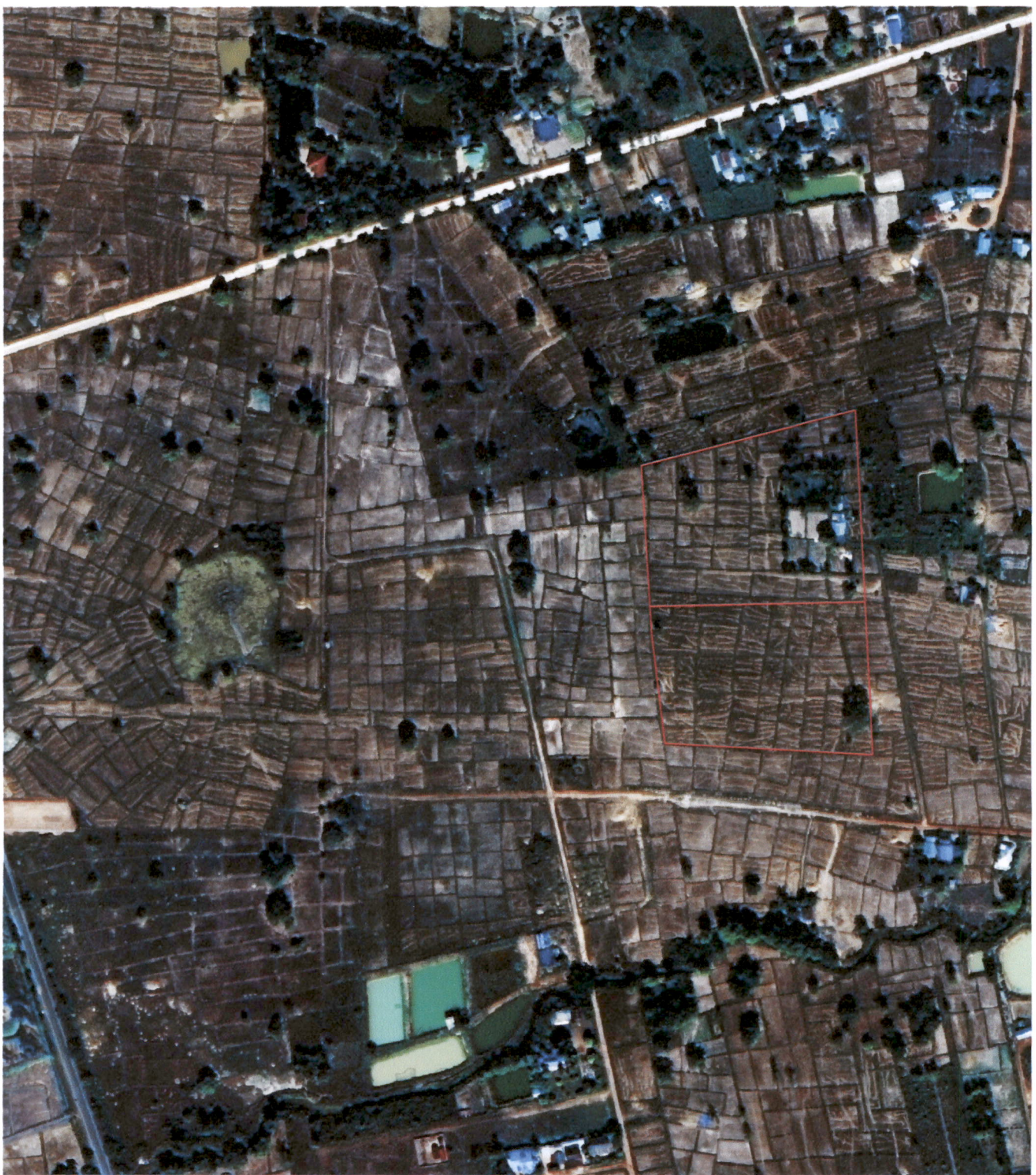
ภาพถ่ายทางอากาศจัดทำขึ้นปี พ.ศ.๒๕๔๕