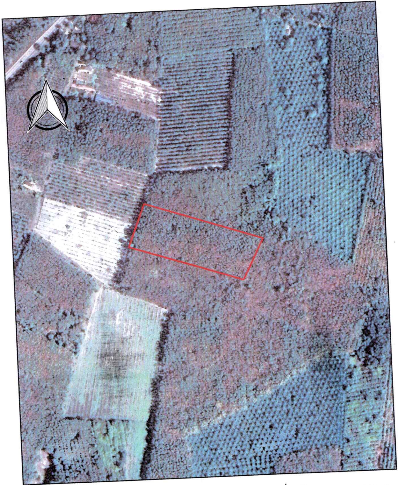
ภาพถ่ายทางอากาศนี้พิมพ์ใช้ในราชการเมื่อปี พ.ศ.๒๕๕๘