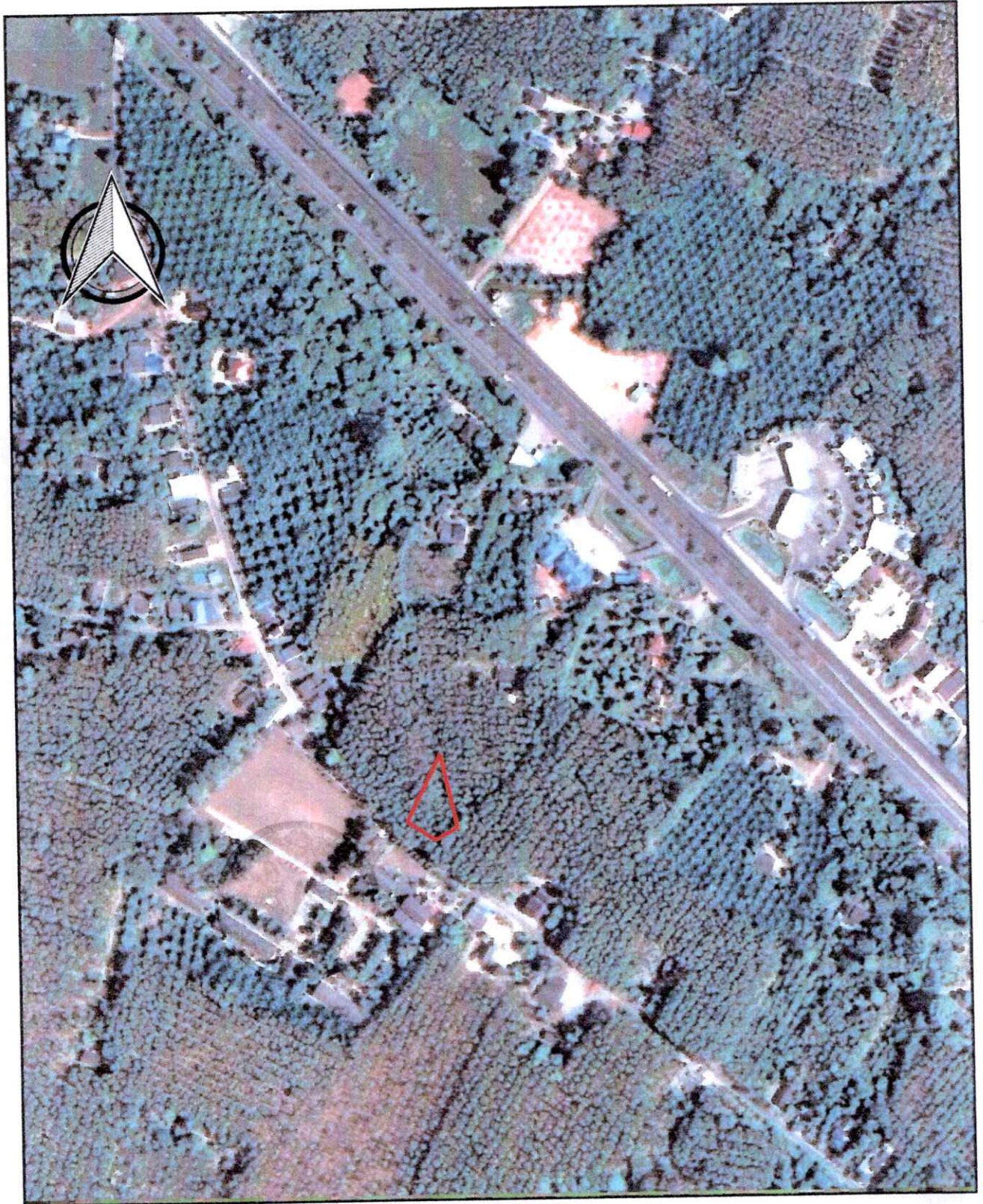
ภาพถ่ายทางอากาศนี้พิมพ์ใช้ในราชการเมื่อปี พ.ศ.๒๕๕๘