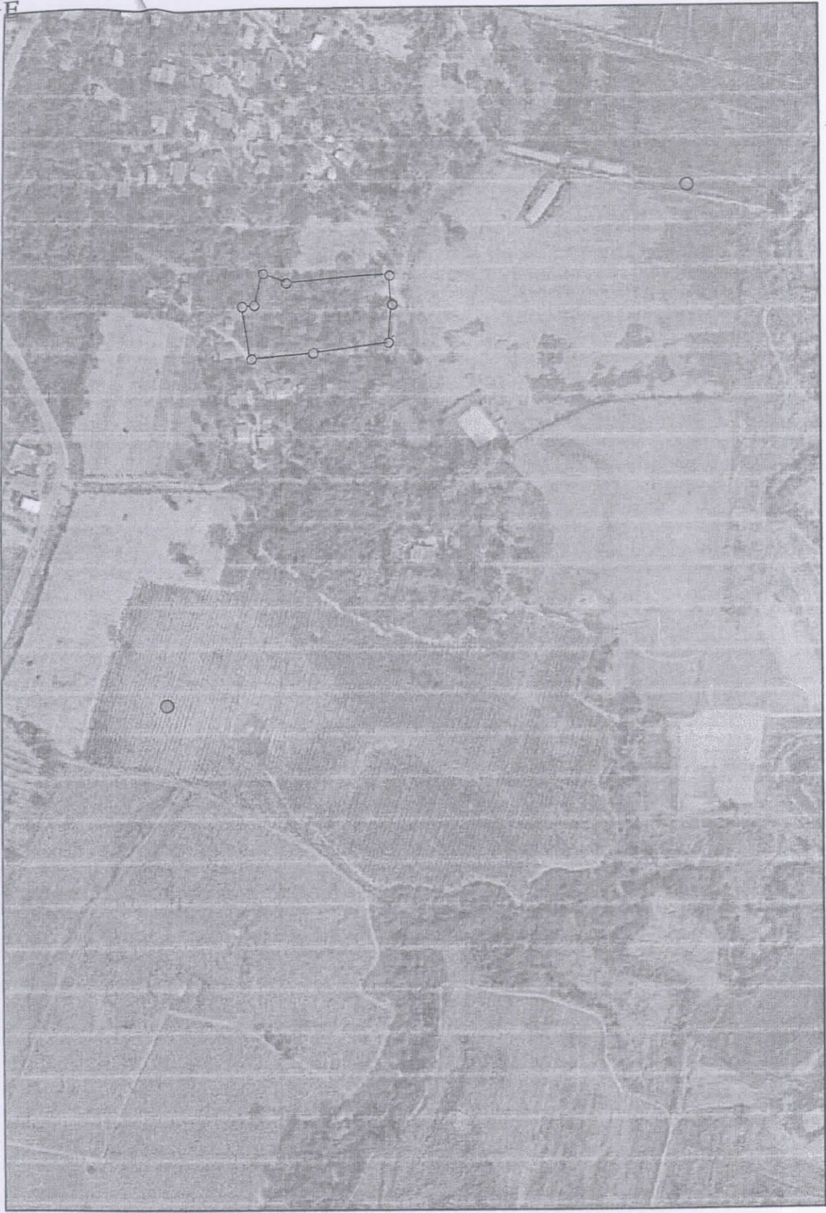
รูปแผนที่จัดสร้างขึ้นเมื่อปี พ.ศ. 2547