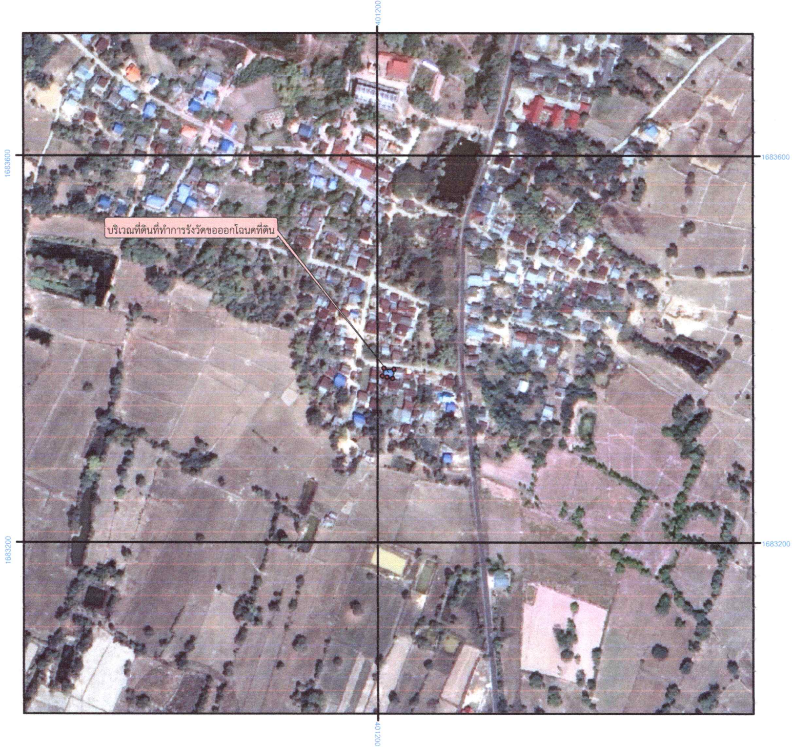
แผนที่ภาพถ่ายทางอากาศ จัดทำขึ้นในปี พ.ศ. ๒๕๕๗