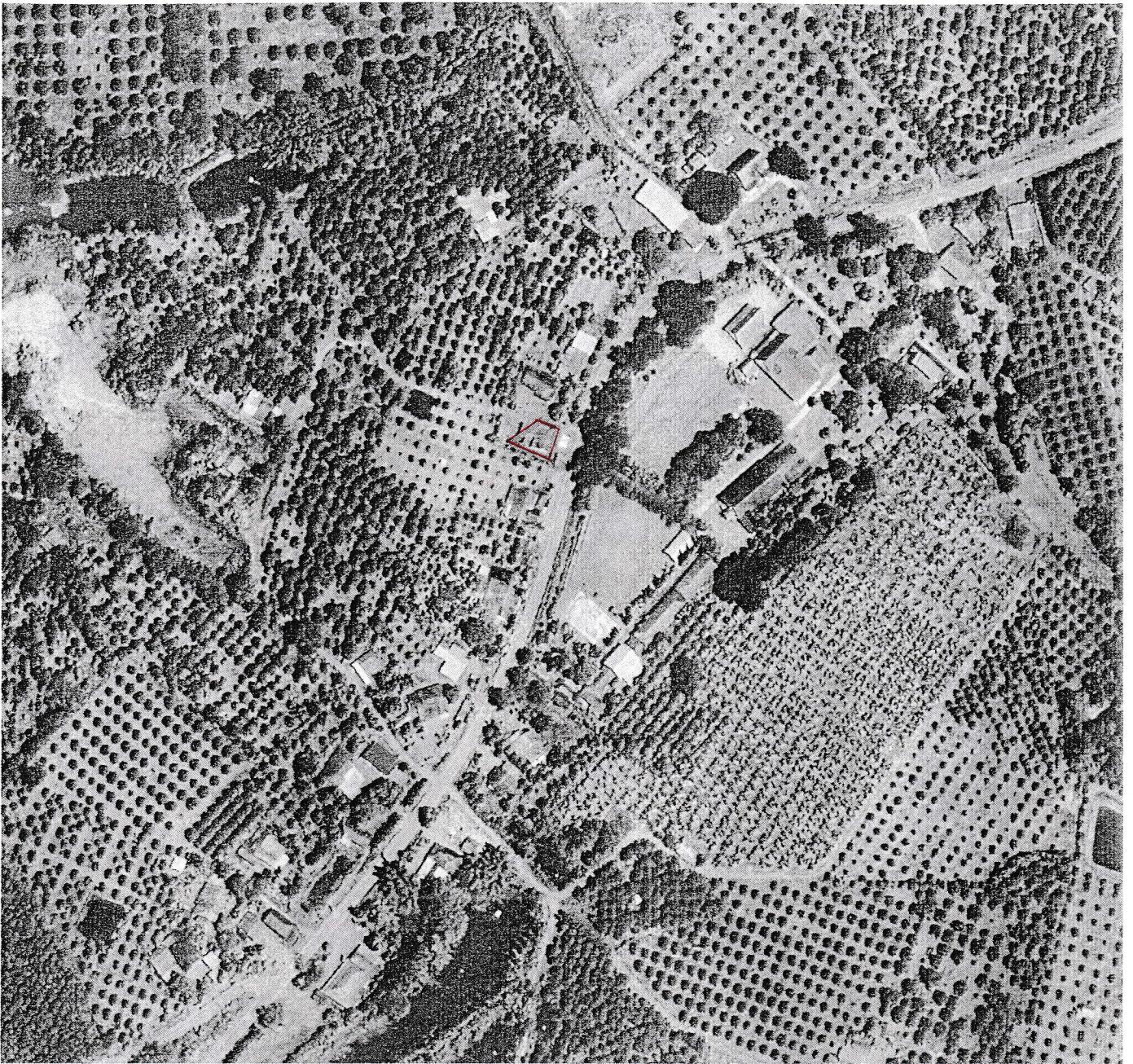
แผนที่ภาพถ่ายทางอากาศนี้จัดทำขึ้นในปี พ.ศ.๒๕๕๗