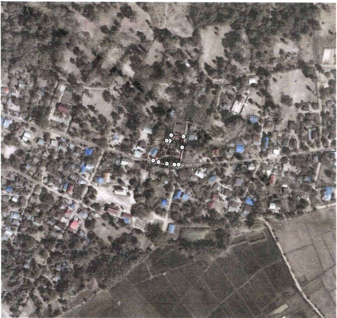
รูปแผนที่ภาพถ่ายทางอากาศ(ออร์โธรีตี) ปี พ.ศ.๒๕๕๗