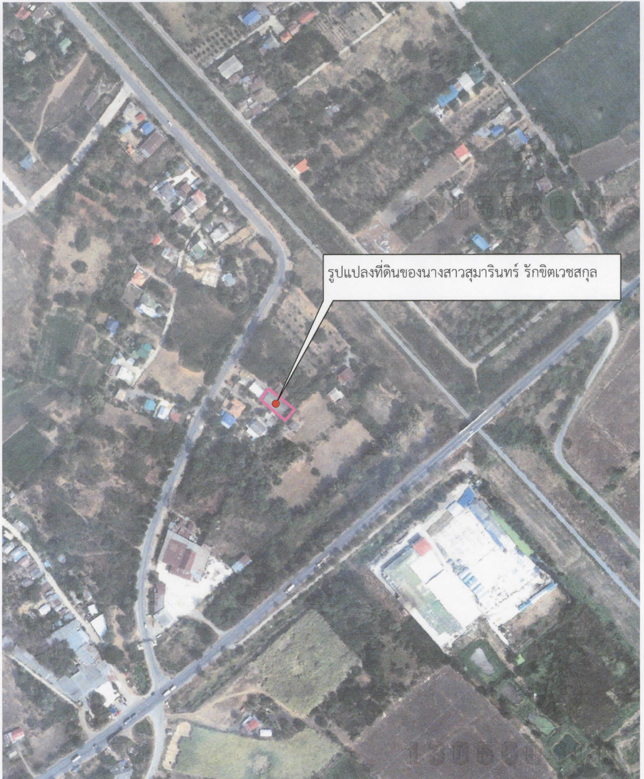
— แผนที่รูปถ่ายทางอากาศนี้ได้จัดทำขึ้นในปี 2559 เส้นสีชมพู แสดงแนวเขตที่ดิน ที่ขออนุญาตที่ดิน