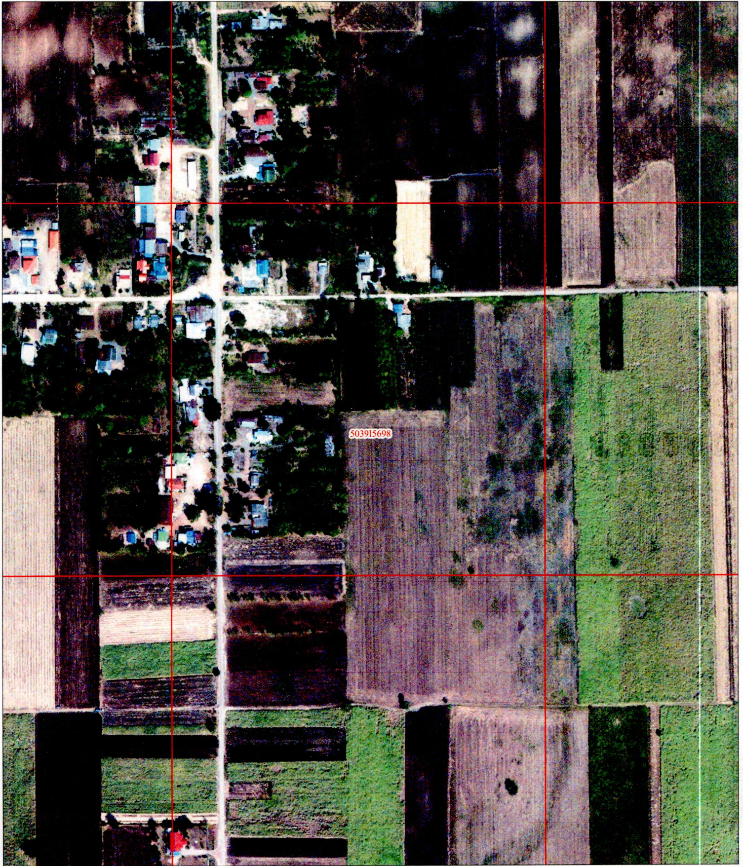
ภาพถ่ายทางอากาศนี้จัดทำขึ้นในปี พ.ศ.2559 เส้นสีดำ แสดงแนวเขตที่ดินแปลงที่ขอรังวัด